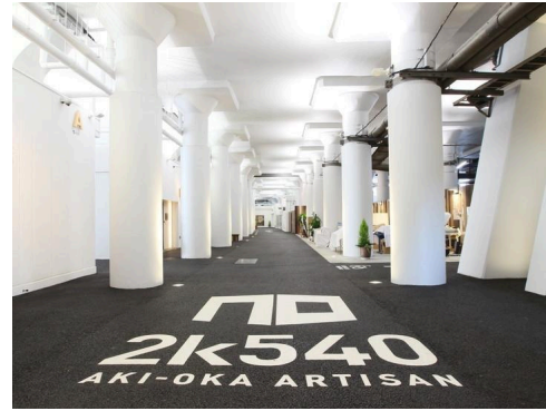
2k540 AKI-OKA ARTISAN