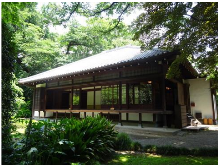
東京国立博物館 茶室