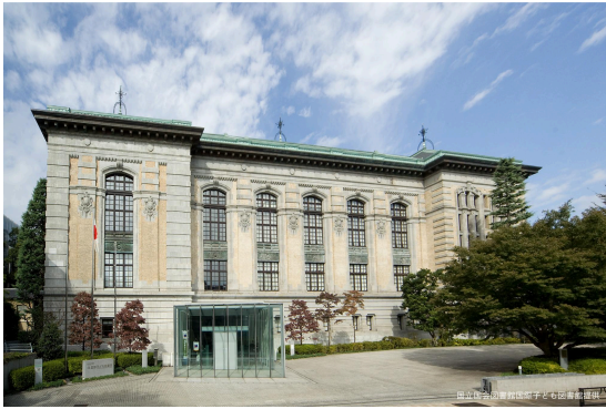
国立国会図書館国際子ども図書館