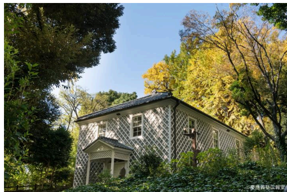
慶應義塾三田演説館